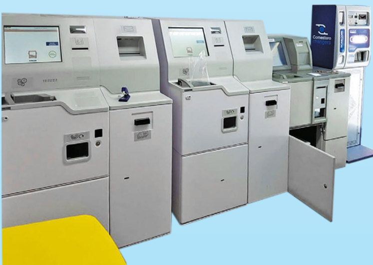
A la izquierda, el CDS-9, de la cuarta generación de equipos de autoliquidación de SCAN COIN. A la derecha, máquina de cambio TOTEM.

En nuestro caso estaríamos en unos 2 años aproximadamente.